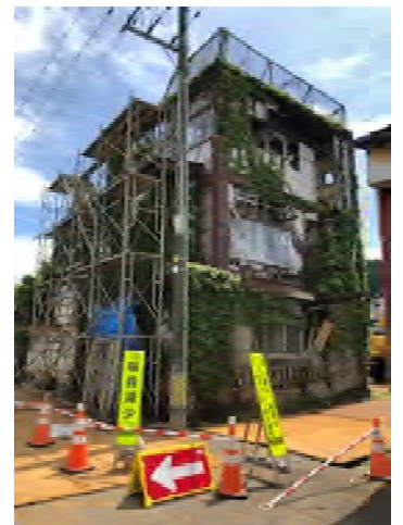
船川曙町内の危険家屋

今年に入ってからは、コロナ禍の影響もあり県・市内での各種会議、行事等もほとんど中止となりましたが、私が個人で関わる市民団体、協議会での会議・スポーツイベント・青少年啓発運動・ボランティア活動には、コロナ対策の徹底に配慮して参加しております。また、船川地区住民からの要望・相談では、側溝、歩道、街路樹、草刈り整備の取り組みを行いました。 その他では、船川地区で長年、危険空き家として住民から撤去してほしいと要望が続いていた危険家屋の撤去工事が終了し、現在は子どもからお年寄りの方まで安心して通行できるようになりました。